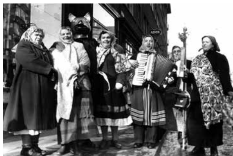
Nach dem Zweiten Weltkrieg feierten im Jahre 1947 Bonnerinnen und Bonner trotz großer Not wieder Karneval

Der älteste bislang vorliegende schriftliche Beleg für die rheinische Fastnacht findet sich in dem zwischen 1219 und 1223 vom Mönch Caesarius von Heisterbach in der Nähe Bonns verfassten „Dialogus miraculorum“, in dem ein gemeinsames Mahl vor der Fastenzeit an Fastnacht beschrieben wird. Weitere frühe Belege für den Karneval in Bonn liegen mit einem